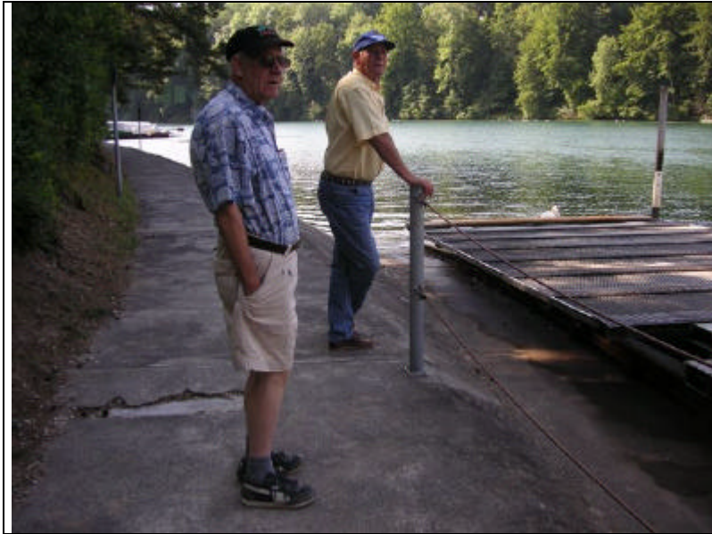
Technische Inspektion der Ueberfahrt