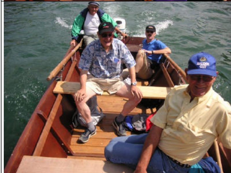
Vor dem Aperero