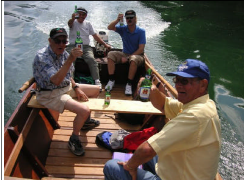
DAS Freitagsbier Exakt um vier Bitte das diskrete Productplacement beachten!