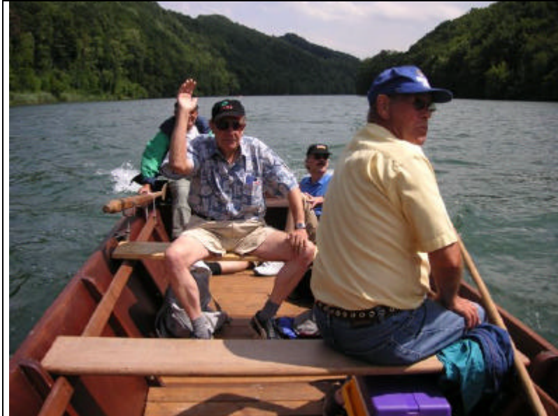
Freie Fahrt Voraus