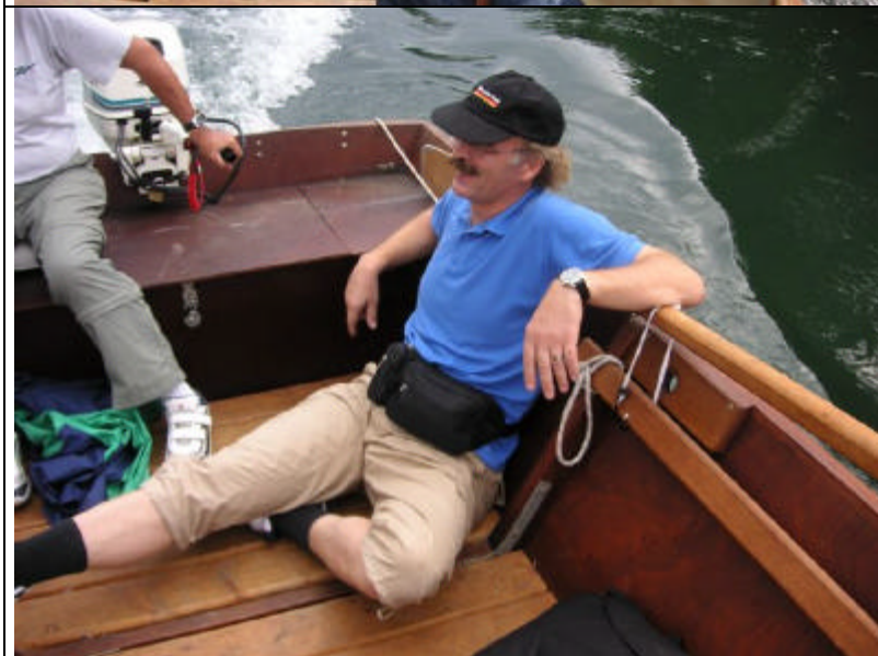
Ausguck nach ertrinkenden oder Havarien...