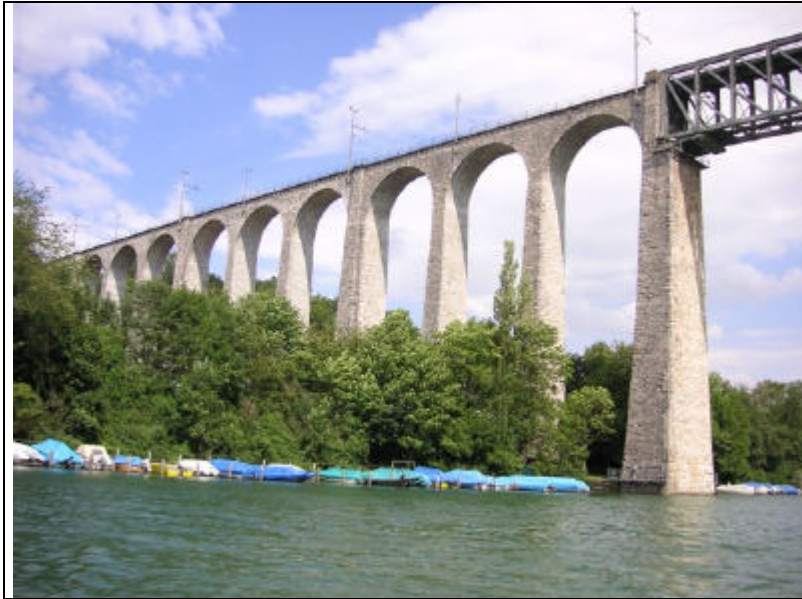
Der Aequator Eisenbahnbrücke Eglisau