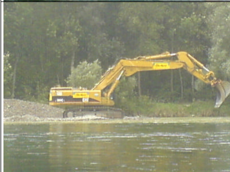
Bagger und Kiesarbeiten an der Thurmündung