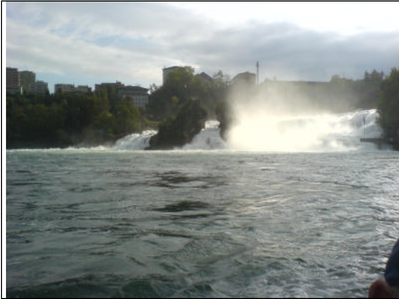
Am Rheinfall wird Anlauf geholt