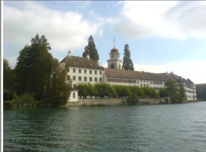
Vorbeifahrt Kloster Rheinau